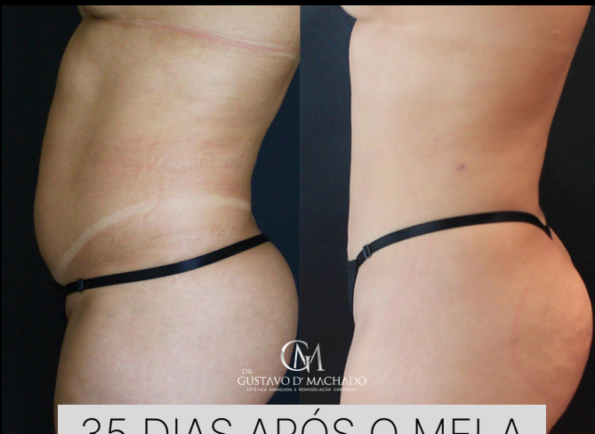
35 DIAS APÓS O MELA