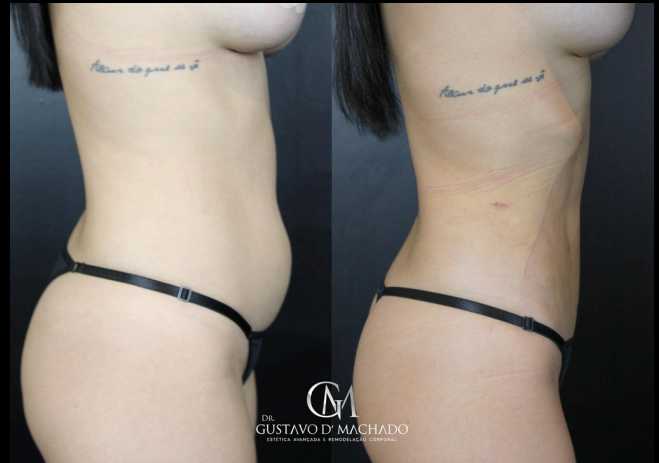
30 DIAS APÓS O MELA