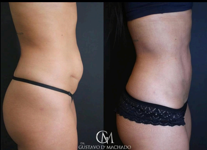
26 DIAS APÓS O MELA