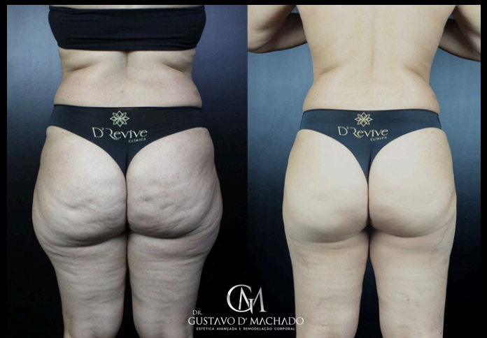
30 DIAS APÓS O MELA