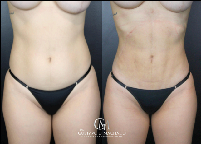
30 DIAS APÓS O MELA